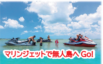
マリンジェットで無人島へ Go!