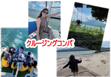
クルージングコンパ