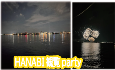
HANABI 観覧 party