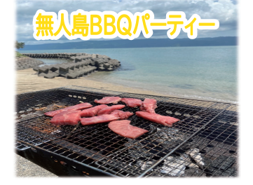
無人島BBQパーティー