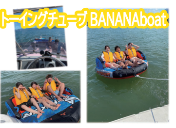
トーイングチューブ BANANAboat