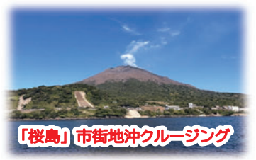
「桜島」市街地沖クルージング